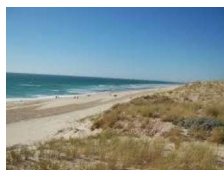
Schéma départemental de développement du tourisme et du thermalisme Conseil départemental des Landes

Vente murs et fonds de commerce hôtel restaurant 3* récemment rénové + 40 chambres + salle de séminaire - parking et piscine Propriétaire Haute Vienne (87)